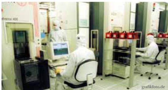
Fraunhofer-Institut für Siliziumtechnologie in Itzehoe

Möglich wurde dies durch den „Ausbildungspakt“, der seit 2003 die Chancen junger Menschen auf dem Ausbildungsmarkt systematisch verbessert hat. Dies schlägt sich in Spitzenwerten nieder: Schleswig-Holstein ist bundesweit führend, was die Anzahl der Berufsschüler im Vergleich zu den Beschäftigten angeht (11,9 Prozent). Angehenden Akademikern bescheinigt der Bildungsmonitor 2010 ebenfalls außergewöhnlich gute Chancen: 72 Prozent der Studienanfänger belegen einen der neuen, europäisch vereinheitlichten Bachelor-Studiengänge (Bundesdurchschnitt: 69 Prozent). Neun staatliche und drei private Hochschulen sowie zwei Verwaltungsfachhochschulen bieten immer mehr Studierenden ein leistungsfähiges Angebot an Studiengängen. Hochschulen und Unternehmen arbeiten eng zusammen, um die Qualifikationsanforderungen der Arbeitswelt bestmöglich abdecken zu können.