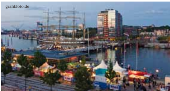
Die Kai-City an der Kieler Hörn bildet ein zentrales Highlight während der Kieler Woche, dem größten Segelsportereignis der Welt.

Wer in Schleswig-Holstein arbeitet, bekommt Urlaubsatmosphäre immer gratis dazu. Das Land lockt mit Badespaß, einzigartigen Landschaften und kulturellen Attraktionen, großstädtischem Flair ebenso wie ländlicher Idylle und einem großen Freizeitangebot. Wer hier heimisch geworden ist, kann sich dem maritim geprägten Lebensgefühl kaum entziehen.